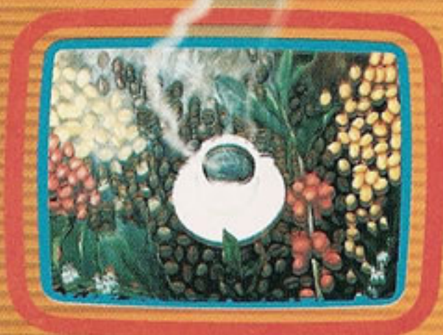
Ilustração: óleo sobre tela de Valéria Vidigal

PROSPECÇÃO DE DEMANDAS DE PESQUISA E TRANSFERÊNCIA DE TECNOLOGIAS PARA OS CAFÉS DA BAHIA